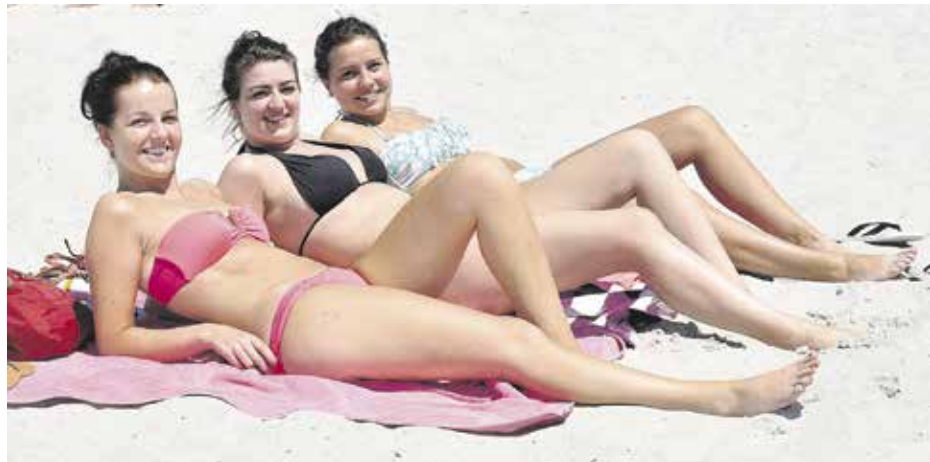
Слънцето е мощен враг на псориазиса

Колкото до понятието „пълно излекуване“, то би трябвало да се редактира и коригира, тъй като в българския език има два основни