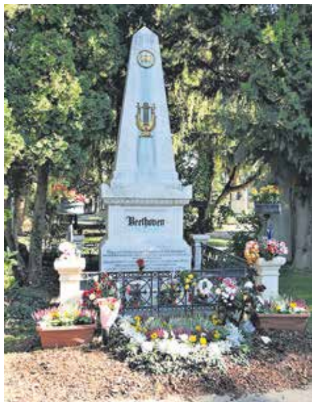
Гробът на Бетовен

• Изгарян е от необяснима треска , която стихва сутрин, а вечер се придружава от изгаряща температура и го довежда до бълнуване... Болестната треска се редува с творческа треска и понякога е просто невъзможно да се отделят, сливат се в едно.