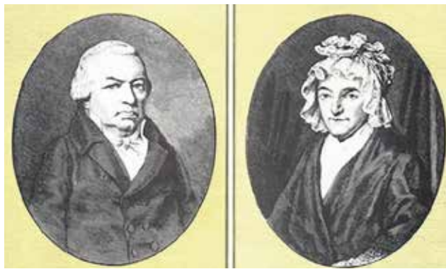
Йохан ван Бетовен и Мария-Магдалена - родители на великия композитор

рим на оскъдни исторически сведения, е ударил сетният час на композитора, на 27 март 1827 г. Към тази тъжна картина трябва да се добави и един важен, макар и необичаен шрих: Йохана, вдовицата на покойния на музиканта брат Каспар, недолюбвана от Бетовен и подозирана от него в разпътен живот, безцеремонно пристъпила към покойния и... отрязала кичур от непокорната му коса.