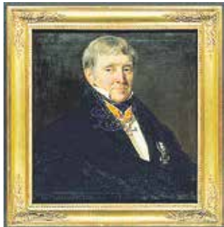
Д-р Франц Вегелер