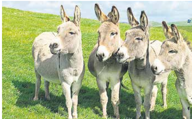
„Магарета“ - така Бетовен често е наричал лекарите, които са го лекували

• 1796-98 г., когато е 26- (според някои автори - 28) годишен, започва да губи слуха си. Недочуването започнало първо с лявото ухо, по-късно и с дясното. Появил се шум в ушите, което му пречило да работи и да общува с хората. Първоначално не можел да чува само високите тонове, след това изчезнали и ниските. Глухотата се усилвала и към 40-44-та си година композиторът напълно