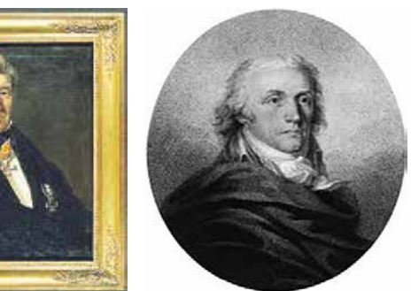
проф. Йохан Шмид

• 18-годишен получил стомашни болки и проблеми с дебелото черво : периоди на тежка констипация (запек) се сменяли с не по-малко тежка диария .