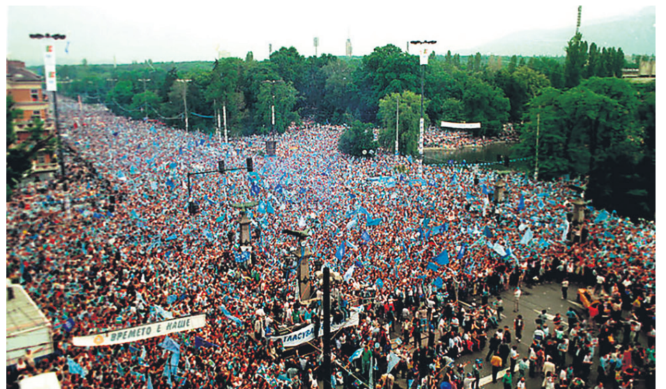
Митингът на СДС, 7 юни 1990 г.

Чак след една година ме споходи най-неочакваната новина – във в. „Дума“ (бившето „Работническо дело“) излезе информация, че шефът на СДС – ЖЕЛЮ ЖЕЛЕВ , който в интервю с мен в в. „Литературен фронт“ – януари 1990 г., заяви: „Аз и сега съм марксист!“, ЗАБРАНИЛ ПУБЛИКУВАНЕТО ВЪВ В. „ДЕМО-