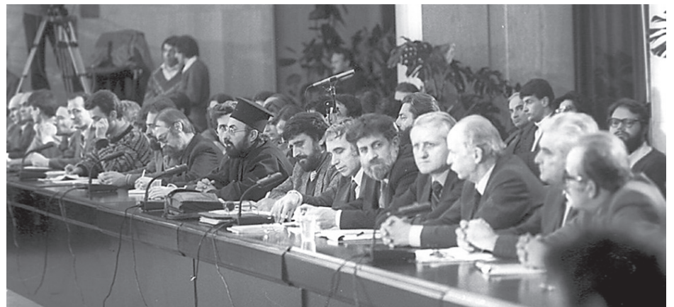
Кръглата маса - януари 1990 г.