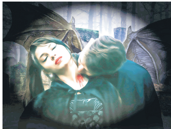
Съвременната представа за Дракула – плакат от изложба в Каталуня

През следващите векове до XVII век българското влияние в църквите на Влахия и Молдова се запазва напълно. След падането под османска власт мощите на българските светци св. Параскева (св. Петка), св. Димитър Нови Бесарбовски и св. Филотея от Търновград се съхраняват в Молдова и Влашко. До края на XIV век България е основен културен стълб в Югоизточна Европа, но след османското нашествие много българи емигрират в отвъддунавските княжества, Русия, Сърбия, на юг. Този процес добре е описан от проф. Самуил Бернщайн: „Много дейци на културата и просветата избягали в Сърбия, Атон, в придунавските княжества и в други страни. Манастирите – културните огнища на феодална България са разрушени или превърнати в джамии“, като лингвистът оповисва появата на нови културни центрове и ролята на българската култура в тях.