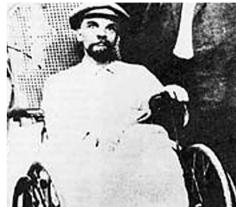
Последната фотография на Ленин, 1923 г.