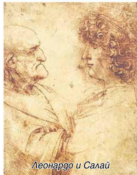
Леонардо и Салай