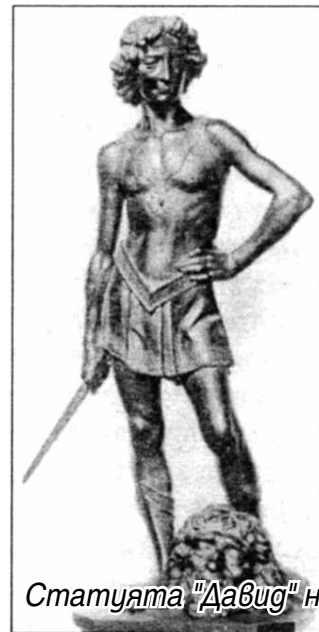
Статуята "Давид" на Верокио и нейна скица

за личния му здравен статус, защото на 19-20-годишна възраст бил заподозрян с още трима младежи, че имал хомосексуални връзки със Салтарели (описан в доноса като „мъжка проститутка“), но разследващите не могли да съберат доказателства по обвинението и тримата