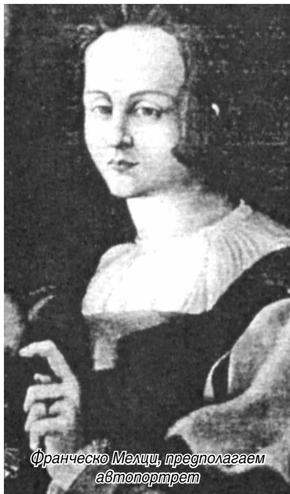
Франческо Мелци, предполагаем автопортрет