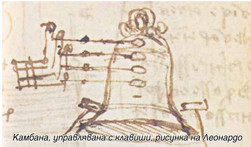
Камбана, управлявана с клавиши, рисунка на Леонардо

2. Работохолизъм. Негови съвременници свидетелстват, че той работел толкова увлечено и всеотдайно (все