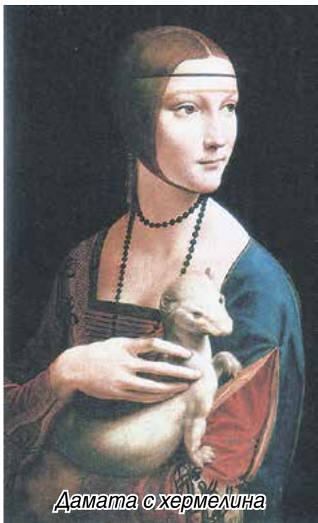
Дамата с хермелина

Това, че Леонардо да Винчи е оригинален, уникален, универсален и гениален