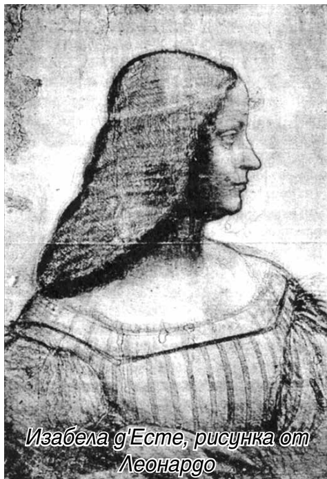
Изабела д'Есте, рисунка от Леонардо

И още нещо – ще свържа тази „диагноза“ с познатите ни вече особености на героя: често недовършване на нещата , неспазване на достоверности, перфекционизъм , защо не и модерния днес, но стар като света синдром на хроничната умора , недиагностицираната (неразбраната и досега!) типична леонардова депресия ... Той сам изтъква, че художниците от неговото ателие (работилница) открили как може да работят изискано и талантливо като работят... бавно.