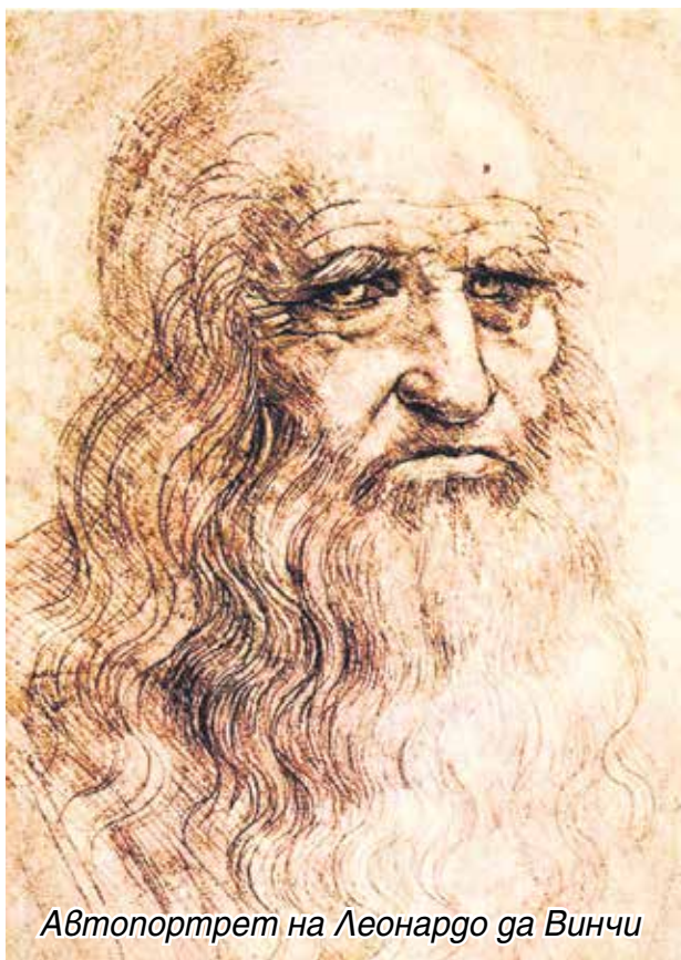
Автопортрет на Леонардо да Винчи

Защо с Леонардо се залових толкова късно? Отдавна бях събрал близо две дузини книги за тази сензационна личност, но още в началото, след като прочетох две-три от тях, се отказах или поточно поотложих флорентинеца за благоприятни времена. Боях се, че няма да ми стигне една година само в четене на литературата за него, но от прочетеното се налагаше и впечатлението, че вероятно ще е невъзможно той да бъде дианозтиран поради почти пълна липса на данни за здравето му.